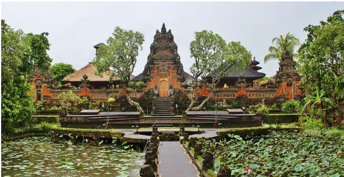
Ubud, Bali

OUVERT À TOUS LES ARTISTES DANS TOUTES DISCIPLINES JANVIER – MARS 2024